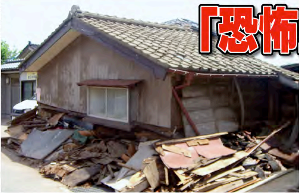
▶新潟県中越沖地震で倒壊した家屋

●発行/大網白里町 ●編集/秘書広報課 ●毎月1日発行 〒299-3292 千葉県山武郡大網白里町大網115番地2 総合案内電話 ☎0475(70)0300(総務課)