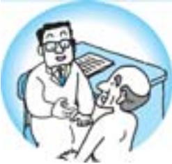
別表1 70歳以上の方の自己負担限度額（月額）

▶対象＝町外の学校等に在学している小学校6年生 ☎健康福祉課健康指導係 ☎(72) 8321