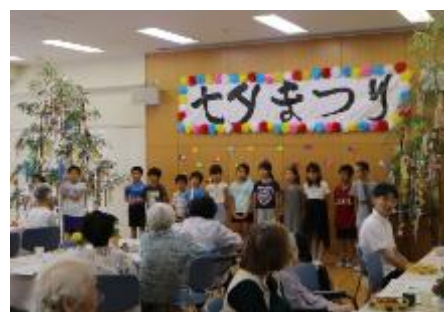
13名がそれぞれの技を披露しました

8月4日（土）には、季美の森南の「夏祭り」で金管部が16：45より演奏を披露します。夏休み中ではありますが、時間がありましたら、金管部への声援をお願いします。