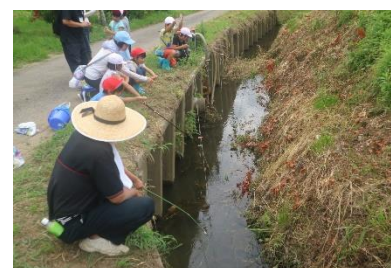
釣り方を教わって上手につれました

また、保護者の皆様におかれましては、道具や服装の準備につきまして多大なるご協力をいただきありがとうございました。