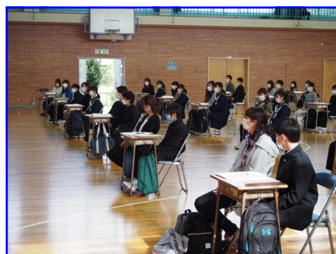
【親子分散登校 全体の様子】