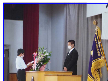
【新入生 誓いの言葉】