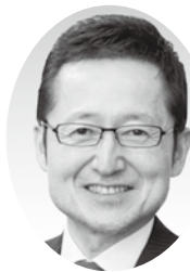
季美の森南2丁目28番地3 ☎78-6578