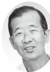
みずほ台2丁目23番地12 ☎73-2843