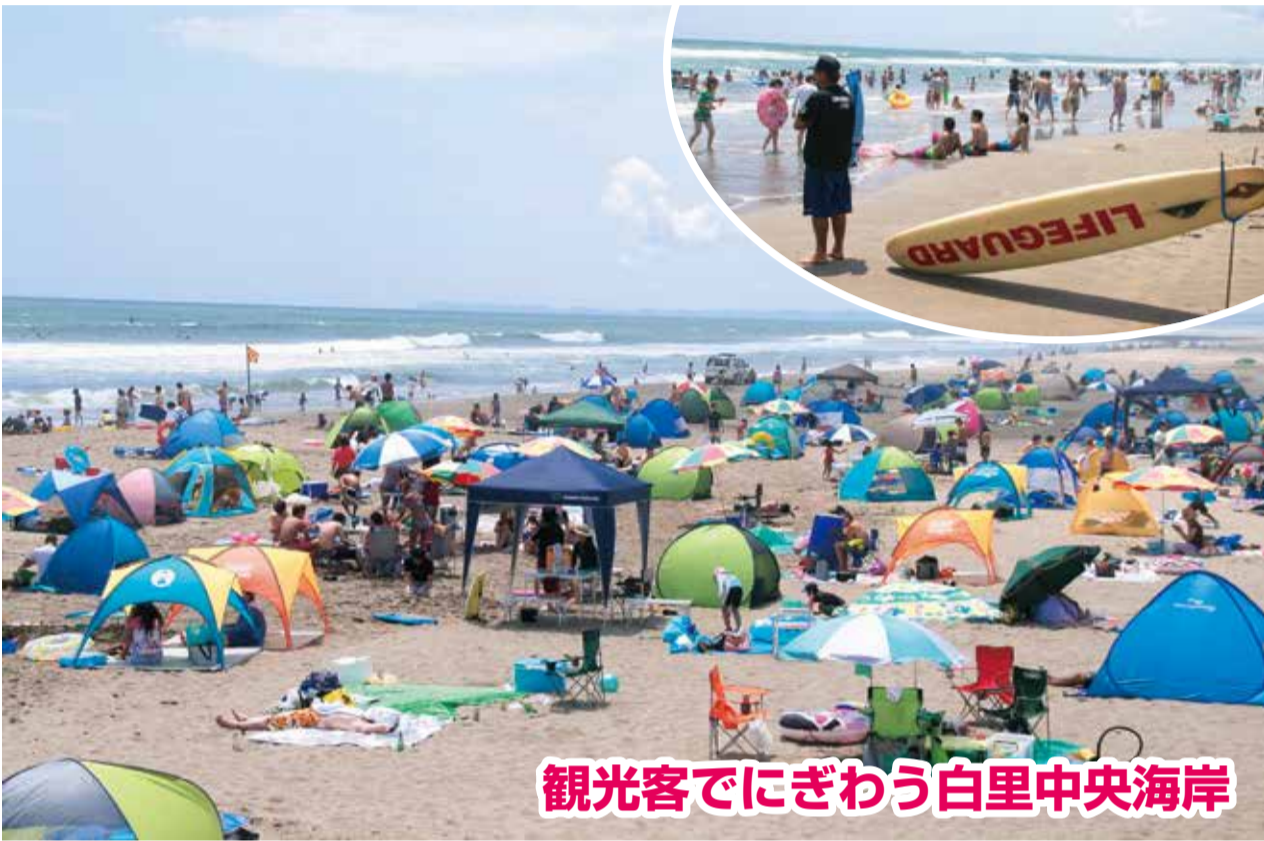
観光客でにぎわう白里中央海岸