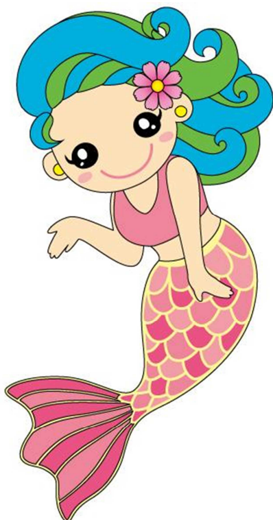
展開デザイン (その2)