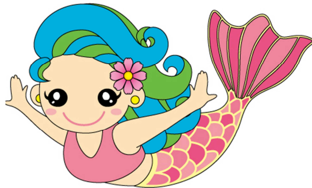
展開デザイン (その1)