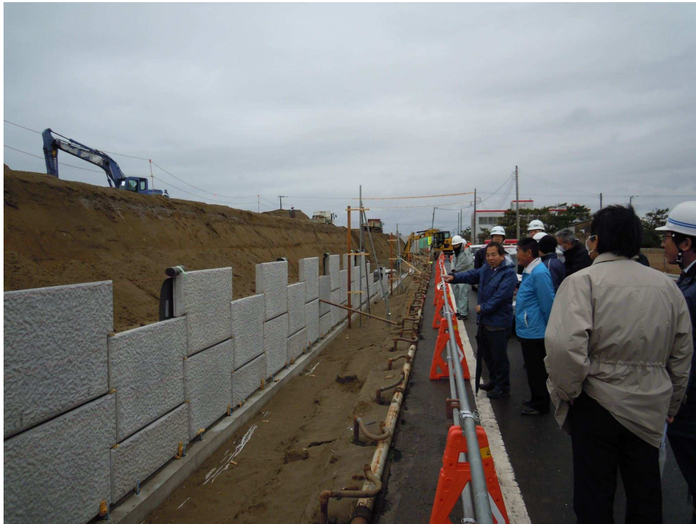
九十九里有料道路（波乗り道路）のかさ上げ工事現場（内陸側）