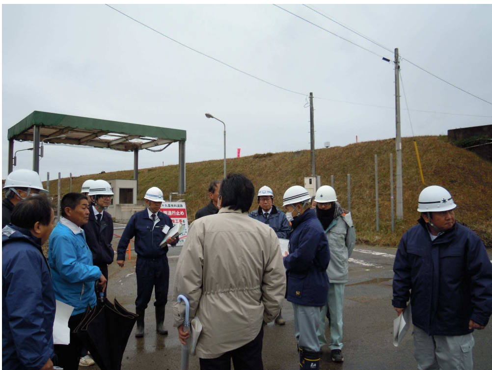
説明を受ける産業建設常任委員会委員