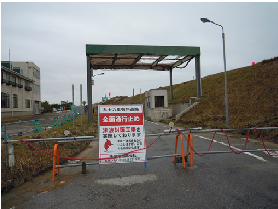
白里中央海岸の工事現場