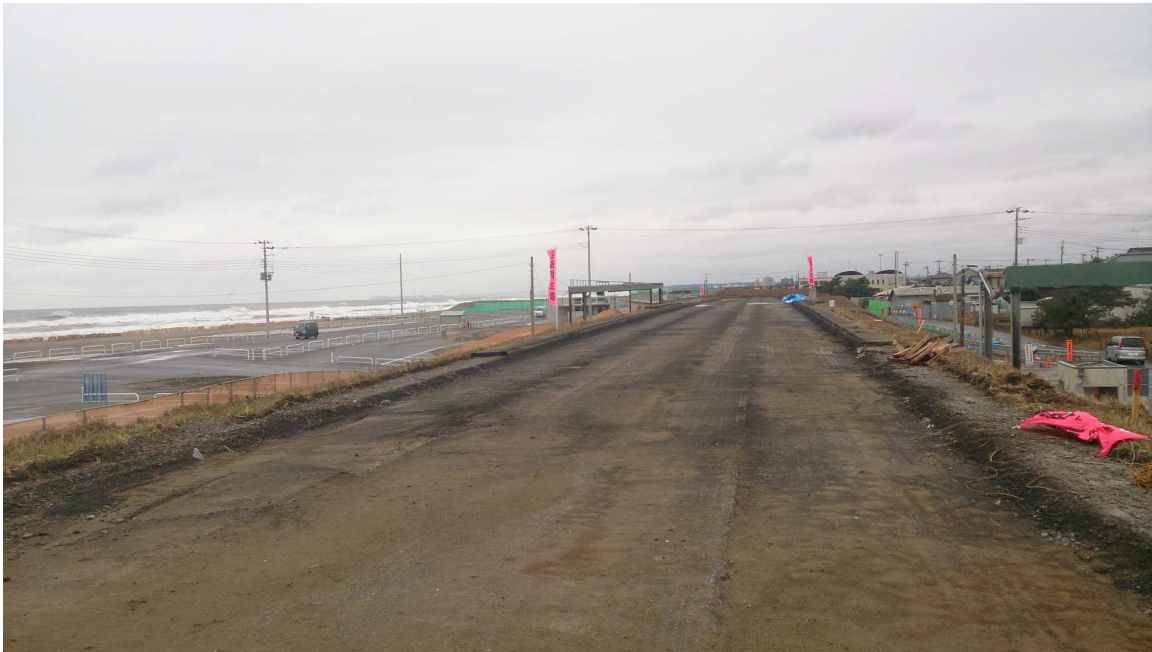
九十九里有料道路（波乗り道路）のかさ上げ工事現場