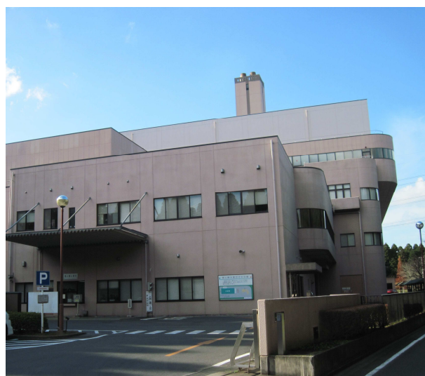
東金市外三市町清掃組合クリーンセンターとパンフレット