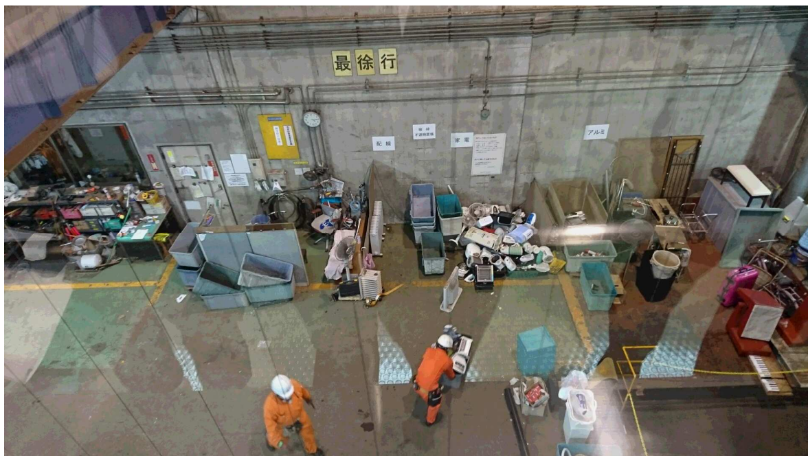
粗大ゴミは、分別されて、再資源化。