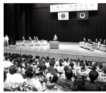
▲前回の成人式の様子

令和2年成人式 ▼日時 令和2年1月12日(日) 14時(受付13時～13時45分) ▼会場 大網白里アリーナ ▼対象 平成11年4月2日～平成12年4月1日生まれの方