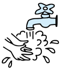
▲健康フェスティバルより

市内でもインフルエンザに感染したという情報があります。インフルエンザを予防するには、一人ひとりの「かからない」、「うつさない」という気持ちが大切です。まずは、手洗いでインフルエンザを予防しましょう。