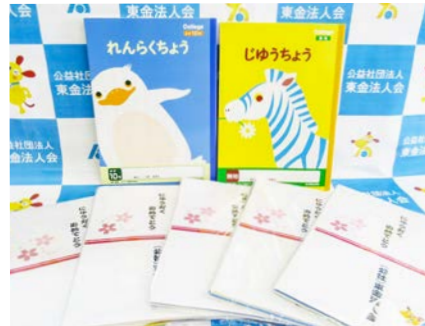
▲配布された連絡帳・自由帳セット