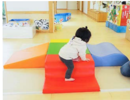
▲室内遊具で遊ぶ様子