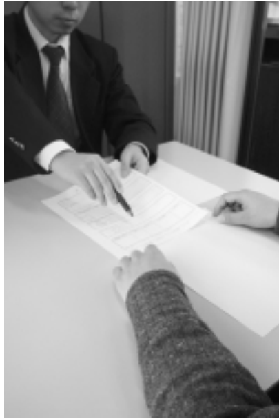
納期までに納付できないときは早めに相談を

日、9時～17時に納付窓口・納税相談窓口を開設しています。平日は忙しいという方は、納付書を持参のうえ、ご利用ください。