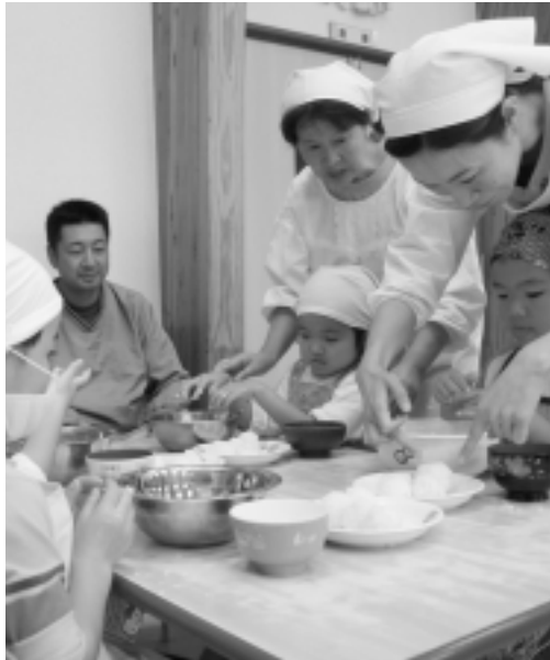
食育体験として行われた収穫祭おにぎりパーティの様子

(内定) 証明書 保護者が病人を介護している場合は、医師の診断書 保護者が病気や出産の前後または心身に障害のある場合は医師の診断書や出産予定日の分かる母子手帳などの写し、または身体障害者手帳の写し 自営業の場合は自営業証明書、農業の場合は農業従事証明書 給与所得者は源泉徴収票(平成20年分)、申告後の確定申告書の写し 平成20年1月1日現在で、本町に居住していなかった方は、平成20年1月1日現在の