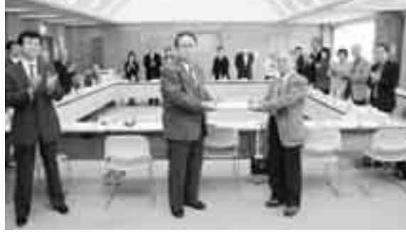
▲町長へ提言を手渡す武井会長