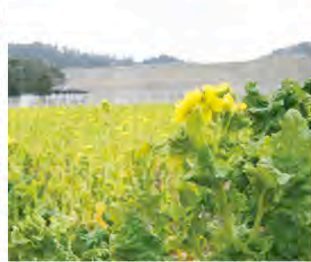
▲公園入り口で来園者を出迎える菜の花

「春の訪れを感じて公園内」 「面が黄色いじゅうたん」 「菜の花」 人々の目だけでなく、舌でも春を感じさせる菜の花。鮮やかな黄色の花を付け、来園者に春の柔らかな香りを届けます。