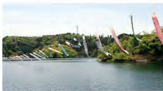
▲湖面上に掲揚された鯉のぼり(昨年の様子)

子どもたちの健やかな成長を願い、小中区ボランティアの方々により、小中池湖面上に鯉のぼりを掲揚します。青空を悠々と泳ぐ光景は壮観です。ぜひ、ご家族やお友達と一緒に来園ください。 ▼期間 4月23日(水)～5月7日(水) ※4月23日に掲揚、5月7日に降納(雨天順延)