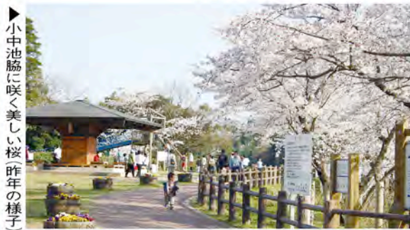
▶小中池脇に咲く美しい桜 昨年の様子

「春風に揺れる桃色カーテン」 「桜」 古くから歌にも歌われ、日本人に愛され続ける桜。この小中池公園でも毎年、見事なまでに咲き誇り、春風に揺れる姿はまるで桃色のカーテンを連想させます。