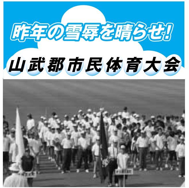
昨年の開会式の様子

昨年惜しくも涙をのんだ山武郡市民体育大会。今年はメイン会場を山武市として、8月17日(日)(予備日24日)を中心に開催されます。優勝旗奪還に燃える選手たちに、盛大な応援を送りましょう。 主会場 山武市成東総合運動公園陸上競技場 昨年の本町成績 総合成績 第2位 優勝種目 陸上女子(4連覇)、柔道(14連覇)、ソフトボール女子、バドミントン男子、バドミントン女子(3連覇)、相撲(3連覇)