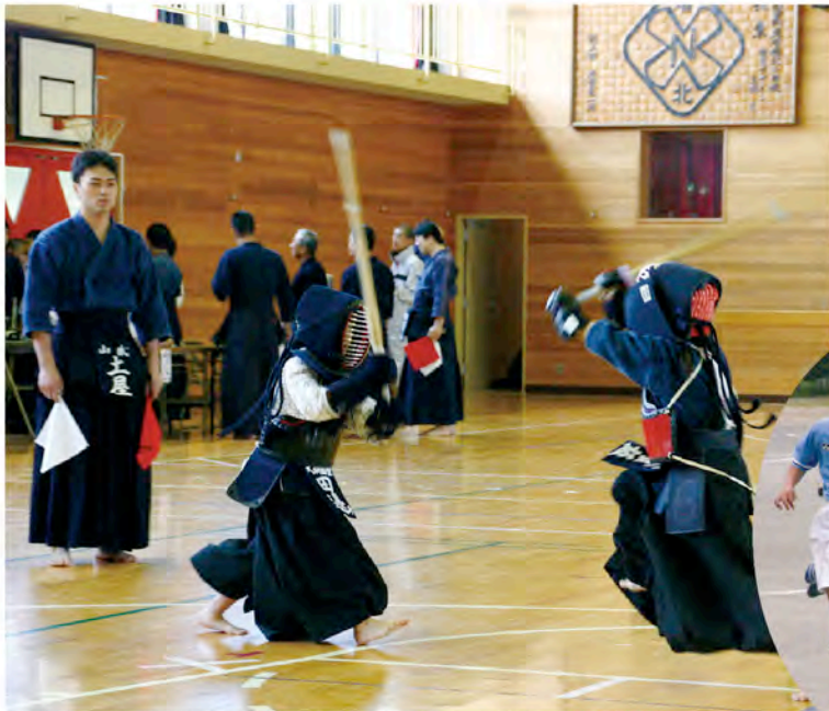
▲優勝を目指して真剣勝負

●発行/大網白里町 ●編集/秘書広報課 ●毎月1日発行 〒299-3292 千葉県山武郡大網白里町大網115番地2 総合案内電話 ☎0475(70)0300(総務課)