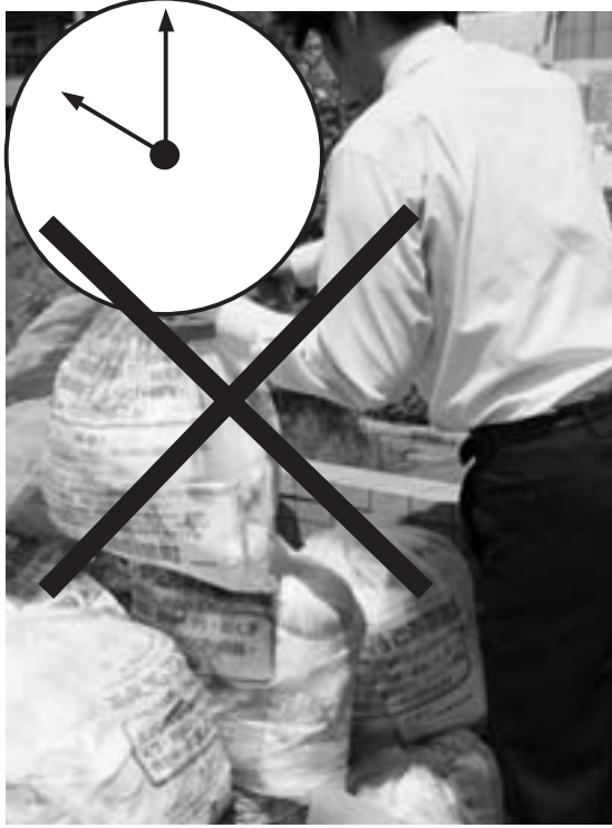
▲ごみは決められた時間内に集積所へ出しましょう

ルールを守らないごみ出しが増えていきます。近所の方の迷惑とならないよう、「ごみ出しルールをしっかり守りましょう。」