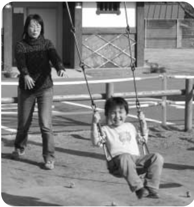
安心して子育てができるように