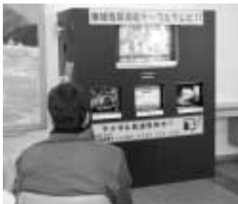
役場ロビーで視聴できます