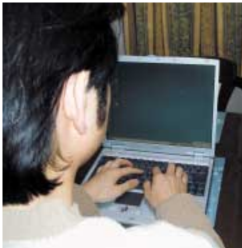
新しい手段としてインターネットでも手続きが可能に