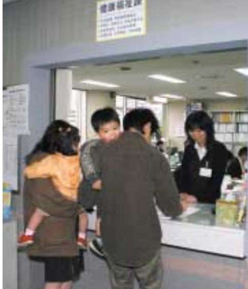
今までは窓口のみの申請・届出が...