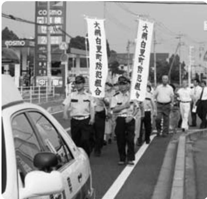
▲増穂地区防犯活動連絡協議会の啓発活動風景

安全で安心なまちづくり旬間が、10月11日(水)から20日(金)まで実施されます。