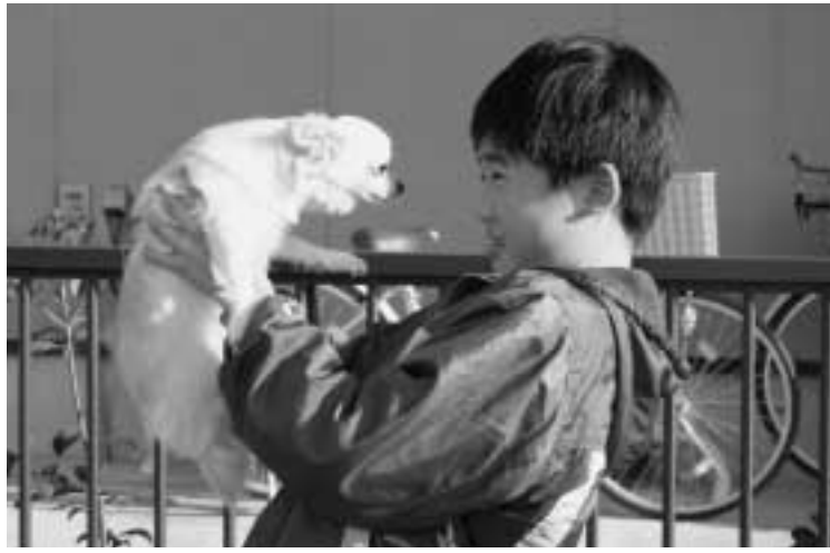
▲ペットも家族の一員です

今まで県と市町村の施設で犬・猫の引き取りを行っていましたが、4月より市町村の施設は廃止され、県の施設のみとなりました。