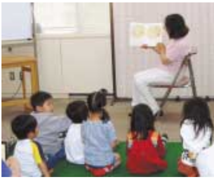
絵本や紙芝居を読み聞かせるおはなし会

絵とともに、ゆったりとした時間を過ごしてみませんか？外に出て、きれいな風景を描く、家で画集を眺めたり、絵画に関する本を読んだり・・・絵画に関する本を展示しています。ぜひ、ご利用ください。