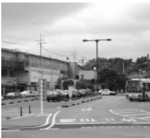
朝夕に混雑がみられるJR大網駅前

JR大網駅の駅前広場は、路線バスやタクシーなどが乗り入れ、駅を利用する上で、重要な場所となっています。朝夕の列車発着時には、送迎を目的とする多くの自家用車でかなり混雑し、公共交通の通行上も支障となつておりますので、自家用車での駅前広場利用には、マナーを守って、みんなが気持ちよく利用できるようにしましょう。