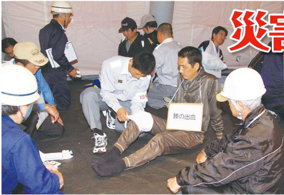
▶ 昨年の町防災訓練で応急手当を学ぶ参加者

●発行/大網白里町 ●編集/秘書広報課 ●毎月1日発行 〒299-3292 千葉県山武郡大網白里町大網115番地の2 総合案内電話 ☎0475(70)0300(総務課)