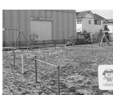
▲設置されたブランコ