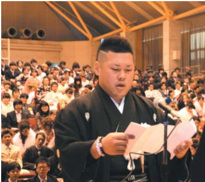
▲二十歳の決意を披露する泉さん