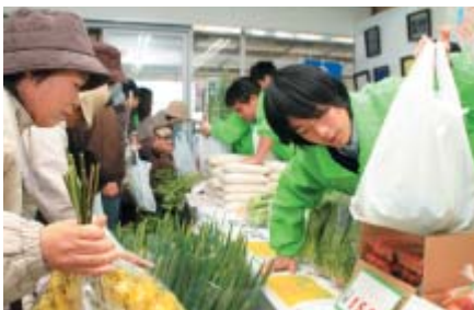
▲元氣に対応する大網高校生徒

と、会場からは大きな拍手が沸き起こりました。式典終了後には、実行委員会が企画をした中学時代の写真のスライドショーと恩師からのビデオレターを映写するイベントを開催。映し出された懐かしい映像を見ながら、思い出話に華を咲かせ、友と過ごしたこれまでの学校生活を忘れぬよう、心に刻みこんでいきました。