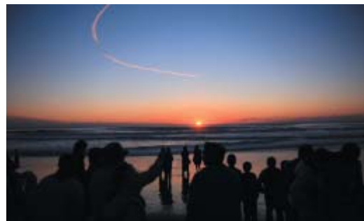
▶白里海岸の初日の出