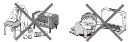
火災の原因になります。 低温やけどになる恐れがあります。