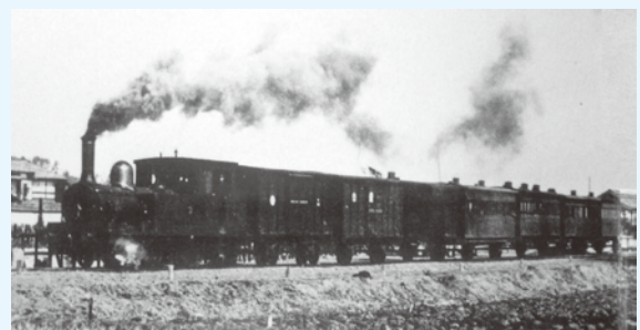
▲東金線開業時に走る蒸気機関車 (写真集「東金・九十九里」より)

地域の皆さんの通勤・通学の足として活躍する東金線は、東金～成東駅間の開業により全線開通し、11月1日で100周年を迎えます。