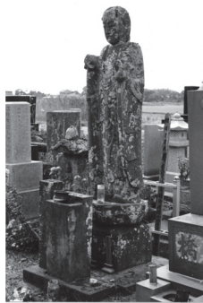
「千人塚」(地藏堂地蔵尊) 旧成東町松ヶ谷