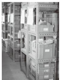
▲保管されている遺物

バブル崩壊により、文化財センターで行う発掘調査の件数は急速に減少を始めた。文化財センターは