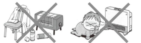
火災の原因になります。低温やけどになる恐れがあります。