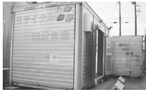
▲リサイクル回収倉庫

家庭から出る紙ごみの中で新聞紙・雑誌・段ボール・飲料用パックのいずれにも当てはまらない「雑がみ」は、捨てずにリサイクルをしましょう。雑がみは市内4カ所(市役