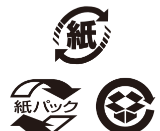
▲リサイクルマークの確認を

商品を入れるレジ袋をもらわずにマイバッグを使用することでも大きなごみの減量につながり、レジ袋の原料となっている原油を消費せずに済みます。