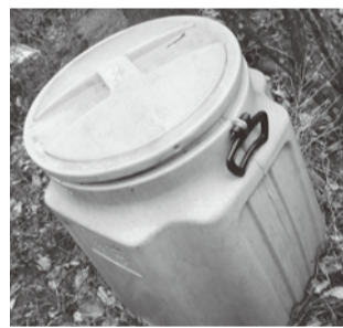
▲生ごみたい肥化装置

食料品は必要な量だけを購入しましょう。また、生ごみを排出する際は十分に水切りを行い、かさを減らしましょう。生ごみはたい肥化することで大幅な減量化が可能です。生ごみたい肥化装置の設置補助金制度を活用しましょう。