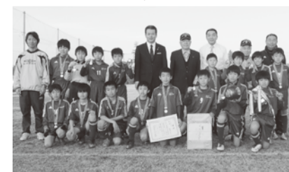
▲小学5年生の部優勝の「城西JFC」