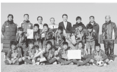
▲中学生の部優勝の「茂原南中学校」