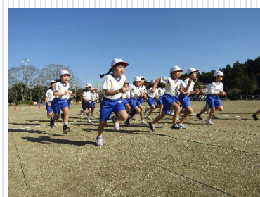
向寒マラソン (マラソン大会)