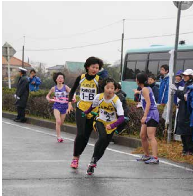
▲たすきをつなぐランナー

熱い声援受け、各市町の精鋭たちが疾走 山武郡市民駅伝競走大会 第44回山武郡市民駅伝競走大会が、2月11日、山武市蓮沼スポーツプラザを発着点として行われました。小雪がちらつく厳しいコンディションの中、各市町の代表選手たちがプライドと自信を持って、精一杯のレースを展開しました。また沿道からの熱い応援も、