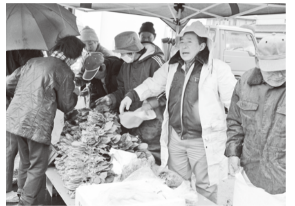
▲雨でも元気に販売しています