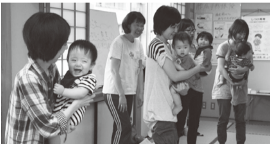
▲ママと遊ぶの楽しいな～♪

また、協力医療機関で行う個別がん検診の申し込みは平成27年1月30日(金)まで受け付けていますので、初めての方もぜひ、申し込みください。