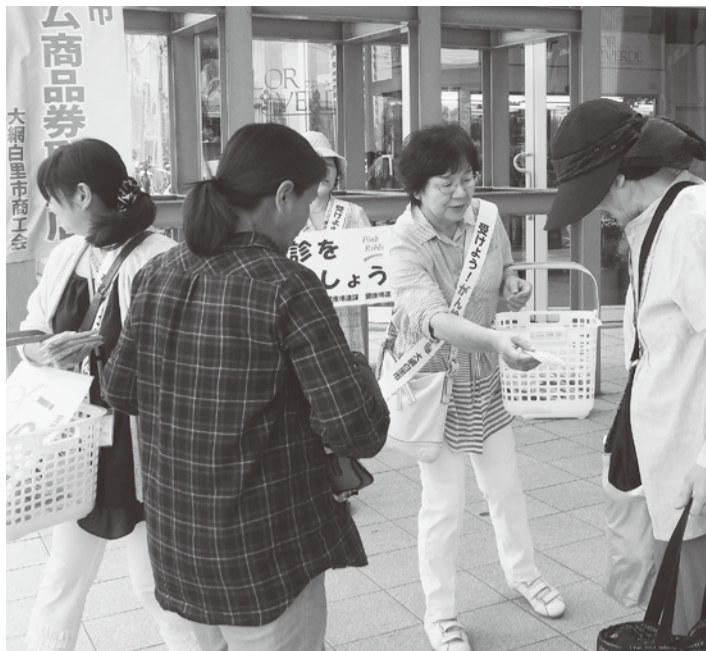
▲買い物客にがん検診受診を呼び掛けるキャンペーン

(保)=保健文化センター、(中)=中部コミュニティセンター、(農)=農村環境改善センターいずみの里 ◎10か月乳児相談とカンガルー教室の対象者には、封書で通知をしています。案内の日時でお越しください。 ◎健康相談・子育て相談は随時行っていますので、お問い合わせください。