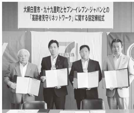
大網白里市・九十九里町とセブン-イレブン・ジャパンとの「高齢者見守りネットワーク」に関する協定締結式

る。この活動が高齢者に安心を与えるとともに、緊急時の早期対応につながることに期待を寄せている」とあいさつしました。