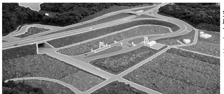
スマートインターチェンジ完成イメージ

（仮称）大網白里スマートインターチェンジは、東金インターチェンジ・ジャンクションと茂原北インターチェンジのほぼ中間地点に位置する小中地区への設置が予定されています。 事業期間（予定） 平成25年度から平成30年度 連結位置 小中地区内