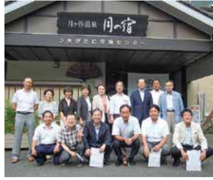
つきがたに交流センター(上勝町)