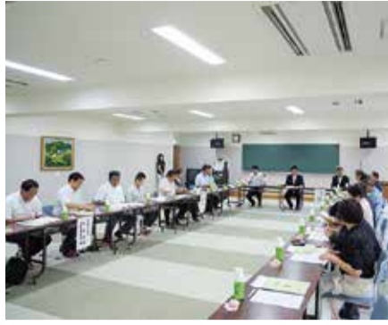
美郷物産館(吉野川市)