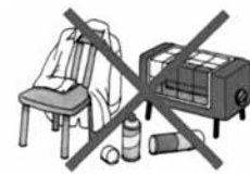
火災の原因になります。