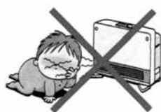
低温やけどになる恐れがあります。