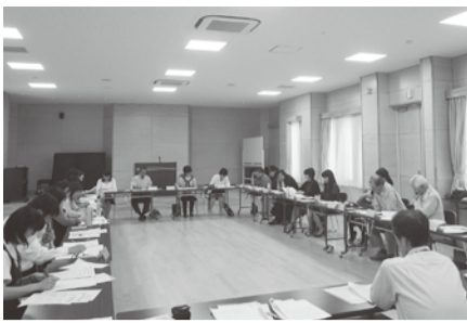
▲情報交換をする参加者たち

5月22日、中央公民館講堂で第5回子育て関連団体交流会が開催されました。当日は、子育て支援に関する活動を行っている市内24団