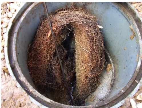
宅内ますの中で成長した木の根 (これが原因で汚水があふれ出る)