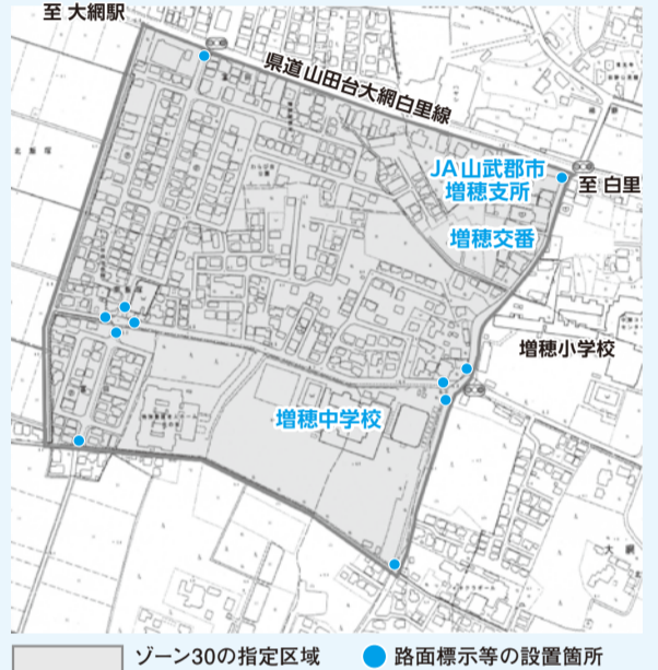
ゾーン30の指定区域 ● 路面標示等の設置箇所