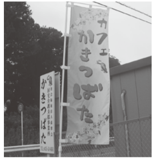
また、カフェかきつばたで、一緒にボランティアとして働くスタッフを募集します。おもしろいヘルシーな「日替わりランチ」を無料で試食できる特典つきです。興味のある方は、ご連絡ください。 ▼日時 11月9日(木)・23日(木・祝) 11時～14時 ▼場所 小規模多機能型居宅介護事業所かきつばた(南横川1726-6) ▼料金 日替わりランチほか定食メニュー 500円 ドリンク 200円 ☎0475(72)8897

チェーンソーを使って枯れ木処理体験を実施します。作業できる服装でお越しください。 ※要事前申込み。 ▼日時 11月25日(土)13時30分～15時 ※雨天時は26日(日)に順延。 ▼会場 十枝の森(北吉田) ▼申込締切 11月17日(金) ▼対象 市内在住の方 ▼その他 チェーンソーは貸与します。手袋、タオルなどを持参してください。 申・岡生涯学習課生涯学習班 ☎0475(70)0380