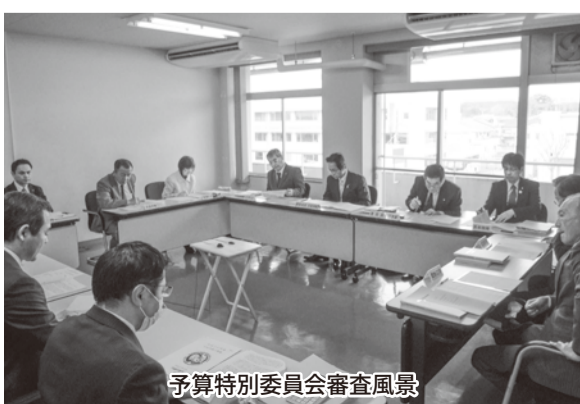
予算特別委員会審査風景