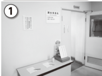
市役所本庁舎3階の議会事務局へ