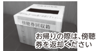
お帰りの際は、傍聴券を返却ください

本会議、委員会ともに会議内容が分かる資料を3部用意していますので、ご覧ください。