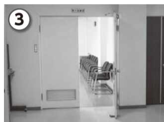
職員の案内で、委員会傍聴席へ