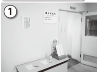
市役所本庁舎3階の議会事務局へ