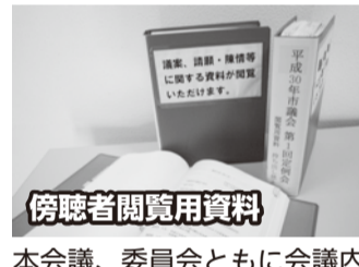
傍聴者閲覧用資料

本会議、委員会ともに会議内容が分かる資料を3部用意していますので、ご覧ください。